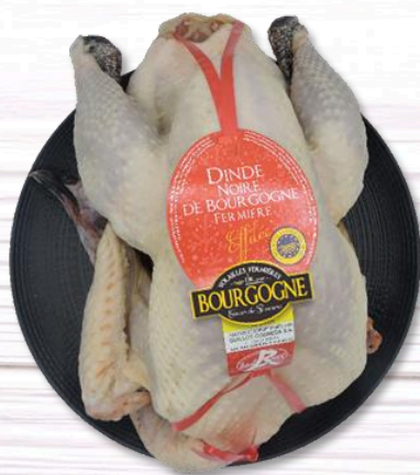
DINDE FERMIERE LR EFFILÉE NUE