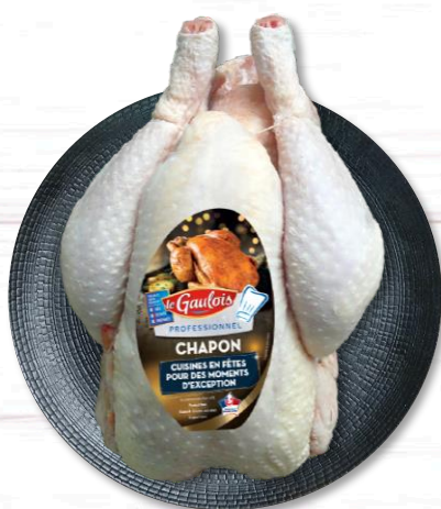
CHAPON PAC NU 10,50€ TTC/kg