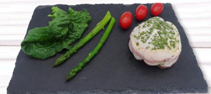
PAUPIETTE CHAPON AUX MARRONS S/ATM X 8 19,50€ TTC/kg