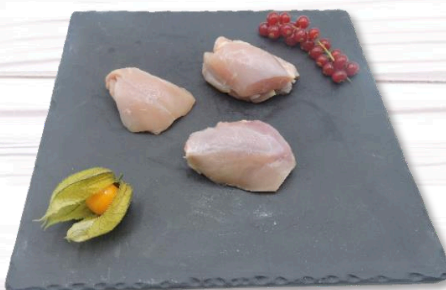
SAUTÉ DE CHAPON SANS PEAU S/V x 2,5 KG 23,50€ TTC/kg