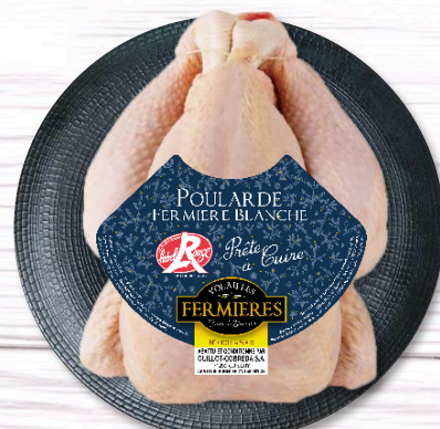
POULARDE FERMIERE LR PAC NUE