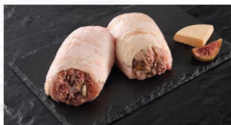
MINI BALLOTIN POULET FIGUE FOIE GRAS S/ATM X 10