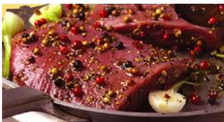
PAVÉ DE CANARD AUX TROIS POIVRES S/V X 10