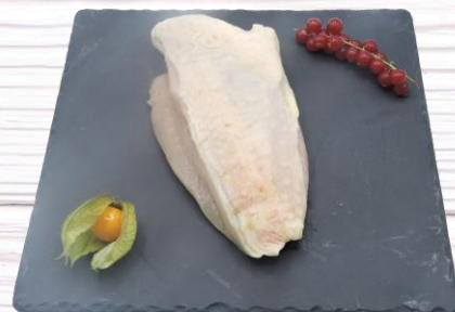
FILET CHAPON S/V x1 24,50€ TTC/kg