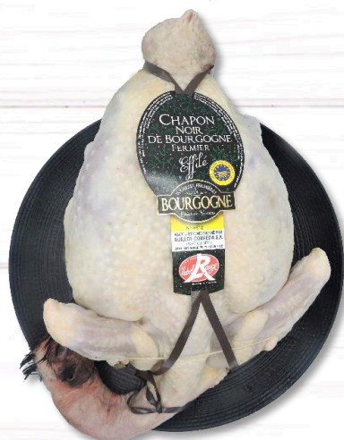
CHAPON NOIR FERMIER LR EFFILÉ NU

Élevage en plein air Vastes parcours herbeux et ombragés