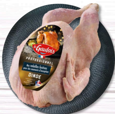
DINDE PAC NUE 7,90€ TTC/kg