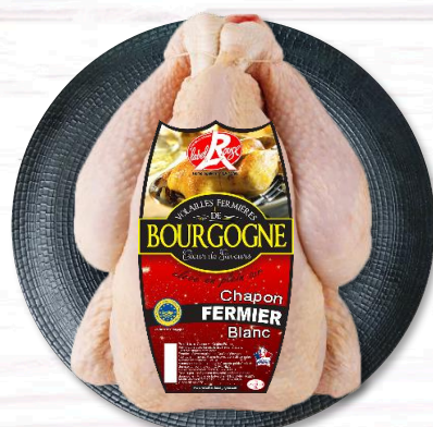
CHAPON BLANC FERMIER LR PAC NU