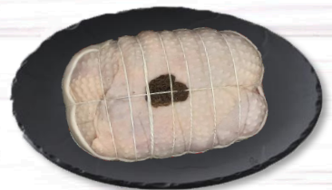
RÔTI CHAPON MORILLES 600 G S/ATM X1 20,50€ TTC/kg