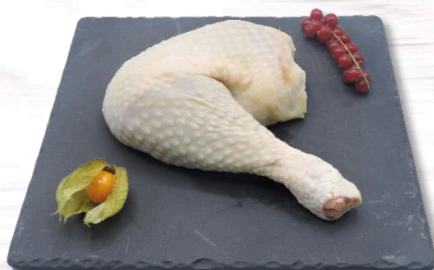
CUISSE CHAPON S/V x4 13,00€ TTC/kg