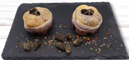
PAUPIETTE PINTADE MORILLES S/ATM X 8 20,00€ TTC/kg