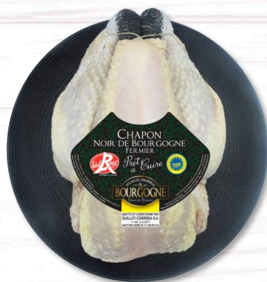
CHAPON NOIR FERMIER LR PAC NU