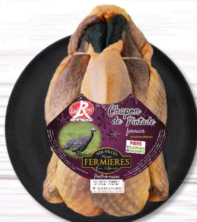
CHAPON DE PINTADE FERMIER LR PAC NU