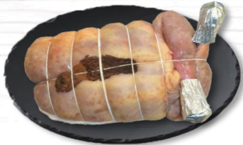
PINTADE SEMI-DÉOSSÉE MORILLES S/ATMX1 18,50€ TTC/kg