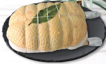
CANETTE SEMI-DÉOSSÉE AUX CÈPES S/ATMX1 15,90€ TTC/kg