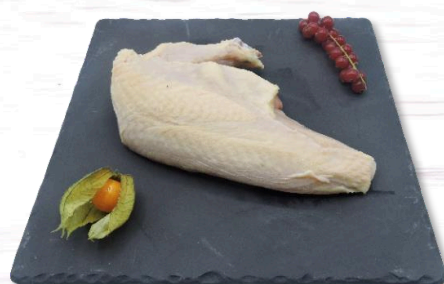
SUPRÊME CHAPON S/V x4 19,50€ TTC/kg