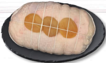
RÔTI CHAPON FOIE GRAS PAIN D'ÉPICES S/ATM X1 21,50€ TTC/kg