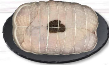
RÔTI CHAPON MORILLES 1,3 KG S/ATM X1 19,90€ TTC/kg