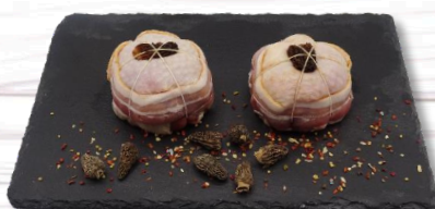
PAUPIETTE CHAPON MORILLES S/ATM X 8 21,50€ TTC/kg