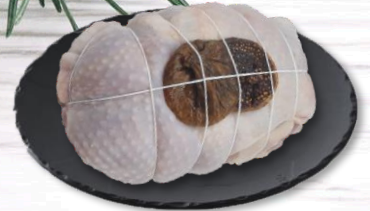
RÔTI POULARDE FOIE GRAS FIGES S/ATMX1 18,90€ TTC/kg